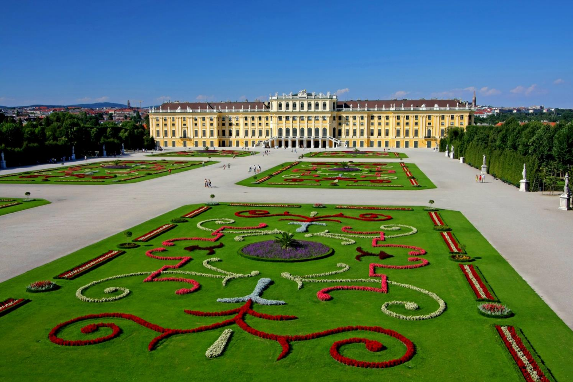
vrtovi palače Schönbrunn