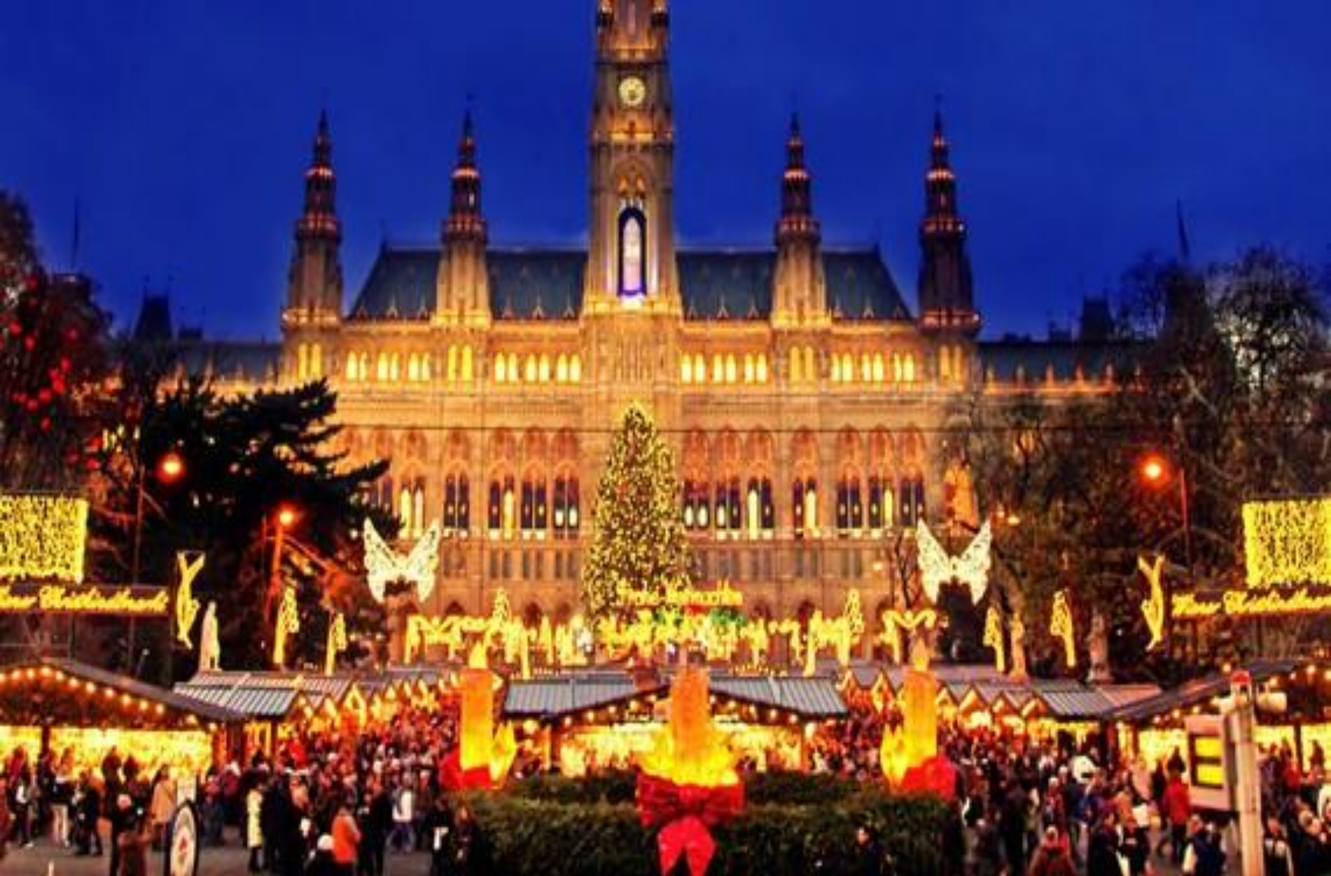
poznati advent u Beču